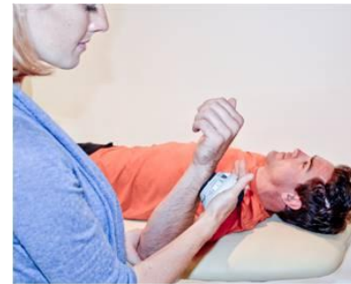
INFRA-ÉPINEUX ET PETIT ROND (C5, 6) ROTATION EXTERNE DE L'ÉPAULE. Placer le MicroFET sur la face externe de l'avant-bras, près du poignet.