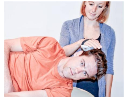
MUSCLES DU COU (C4, 5, 6) INCLINAISON DE LA TÊTE. Placer le MicroFET sur la face latérale du crâne, au-dessus de l'oreille.

Tél : 01 60 19 34 35 Fax : 01 60 19 35 27 www.biometrics.fr