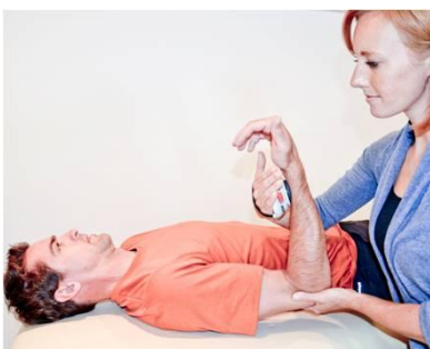
BICEPS & BRACHIAL (C5, 6) FLEXION DU COUDE. Placer le MicroFET sur la face antérieure de l'avant-bras, près du poignet.