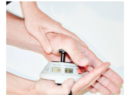
ADDUCTEUR DU POUCE (C8, T1) ADDUCTION DU POUCE. Placer le MicroFET sur la face interne du pouce, près de la paume.