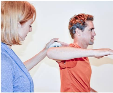
FAISCEAU MOYEN DU DELTOÏDE (C5, 6) ABDUCTION DE L'ÉPAULE. Placer le MicroFET sur la face supérieure de du bras, au dessus du coude.