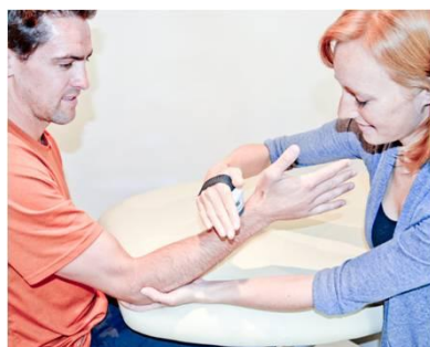
BRACHIO-RADIAL (C5, 6) FLEXION DU COUDE. Placer le MicroFET sur la face radiale de l'avant-bras, près du poignet.