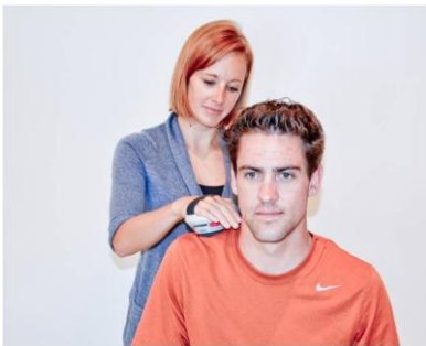
TRAPÈZE MÉDIAN (C3, 4) ADDUCTION SCAPULAIRE. Placer le MicroFET à l'angle latéral de l'omoplate, près de l'articulation de l'épaule.