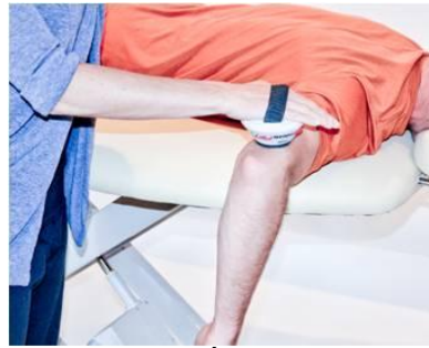
FAISCEAU POSTÉRIEUR DU DELTOÏDE (C5, 6) ABDUCTION HORIZ. DE L'ÉPAULE. Placer le MicroFET sur la face postérieure du bras, près du coude.